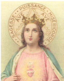
Illustration ancienne et rare de Notre Dame des 3 Avés Maria qui montre l'importance de l'auréole

Il est également possible de nous soutenir par votre don libre déductible des impôts et/ou votre adhésion pour 2023. mail site https://www.payasso.fr/eglise-de-champigne/adhesion